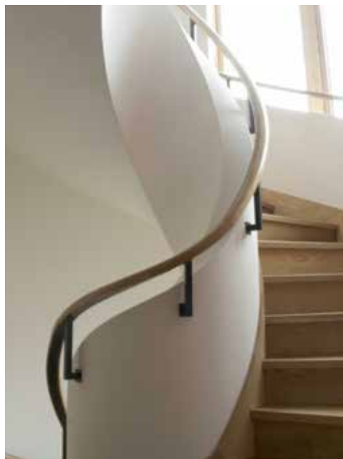
Casa na Estrela