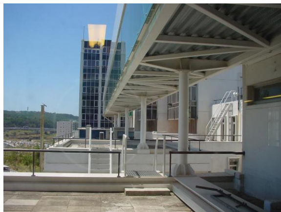
Fig. 3 - Ligação ao edifício nascente