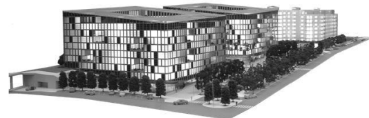
Fig. 1 – Lotes 69 e 70

A espessura geral das lajes é de 0.22 m, condicionada pelos vãos maiores de 6.15 m.