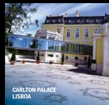
CARLTON PALACE LISBOA