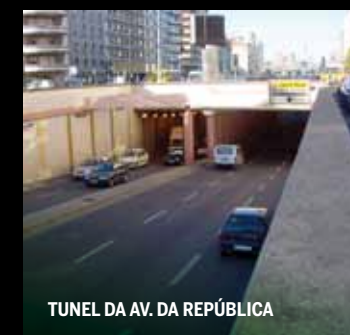
TUNEL DA AV. DA REPÚBLICA