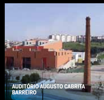
AUDITÓRIO AUGUSTO CABRITA BARREIRO