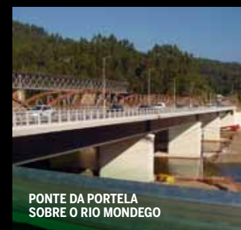
PONTE DA PORTELA SOBRE O RIO MONDEGO