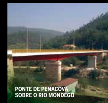
PONTE DE PENACOVA SOBRE O RIO MONDEGO