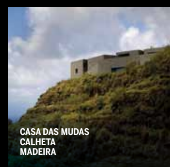
CASA DAS MUDAS CALHETA MADEIRA