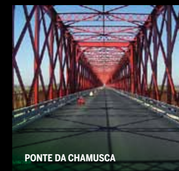
PONTE DA CHAMUSCA