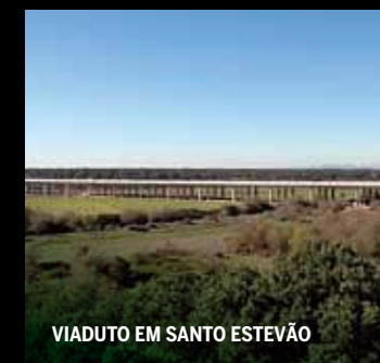
VIADUTO EM SANTO ESTEVÃO