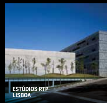
ESTÚDIOS RTP LISBOA