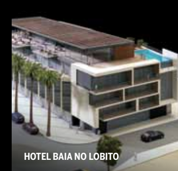
HOTEL BAIA NO LOBITO