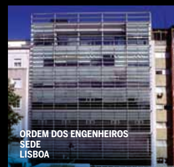
ORDEM DOS ENGENHEIROS SEDE LISBOA