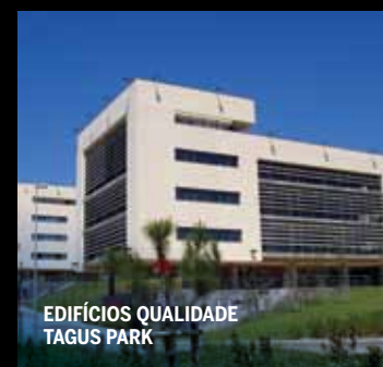
EDIFÍCIOS QUALIDADE TAGUS PARK