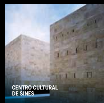
CENTRO CULTURAL DE SINES