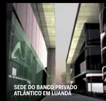
SEDE DO BANCO PRIVADO ATLÂNTICO EM LUANDA