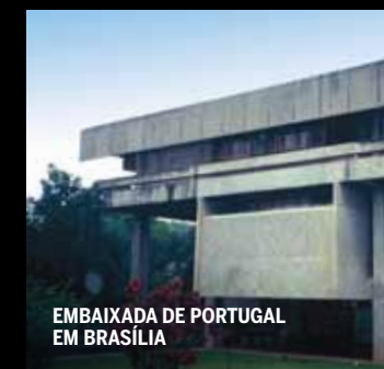
EMBAIXADA DE PORTUGAL EM BRASÍLIA

O corpo técnico da BETAR inspeciona e apoia os seus clientes na gestão dos seus Pórticos, incluindo a verificação de segurança destas estruturas, frequentemente negligenciadas