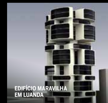
EDIFÍCIO MARAVILHA EM LUANDA