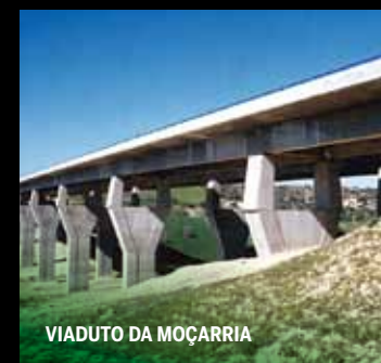
VIADUTO DA MOÇARRIA