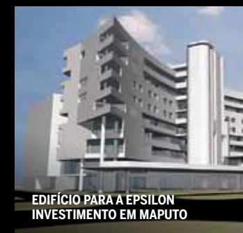
EDIFÍCIO PARA A EPSILON INVESTIMENTO EM MAPUTO