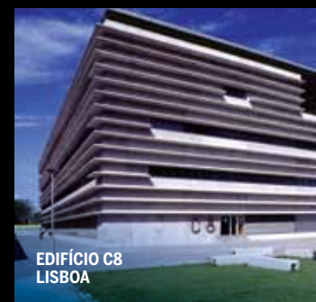
EDIFÍCIO C8 LISBOA