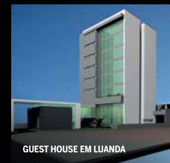
GUEST HOUSE EM LUANDA