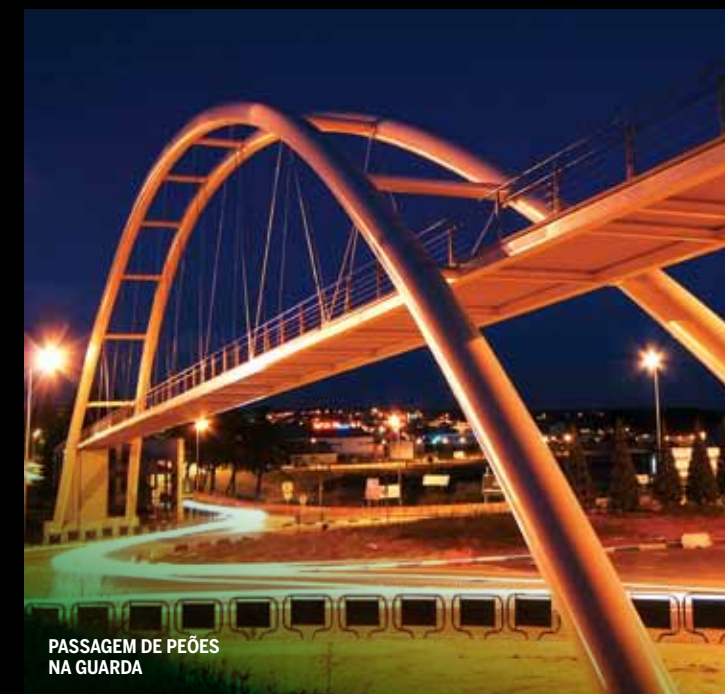
PASSAGEM DE PEÕES NA GUARDA