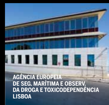
AGÊNCIA EUROPEIA DE SEG. MARÍTIMA E OBSERV. DA DROGA E TOXICODPENDÊNCIA LISBOA