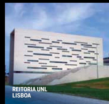
REITORIA UNL LISBOA