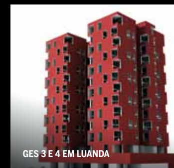
GES 3 E 4 EM LUANDA