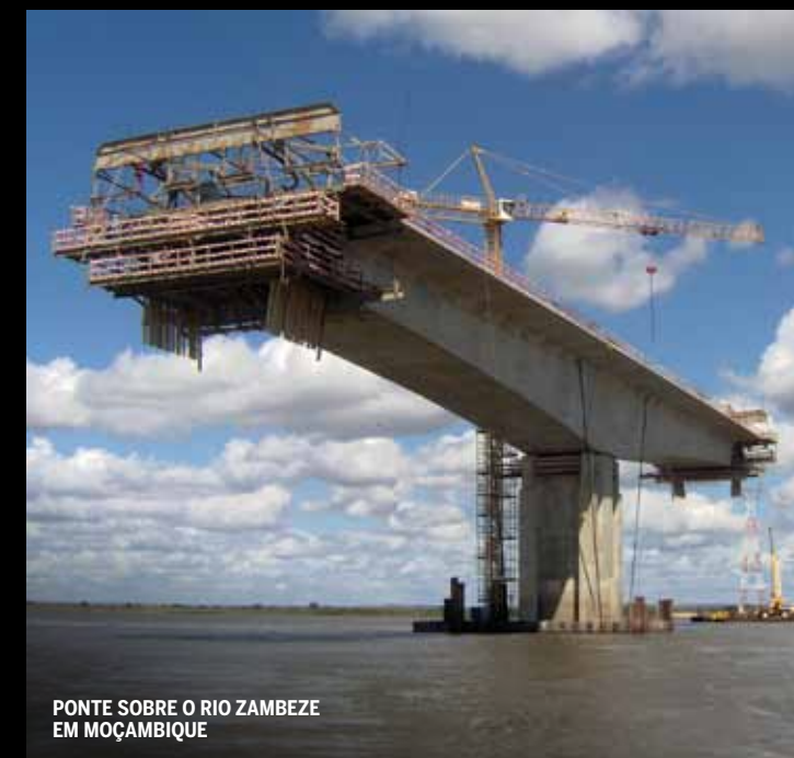
PONTE SOBRE O RIO ZAMBEZE EM MOÇAMBIQUE