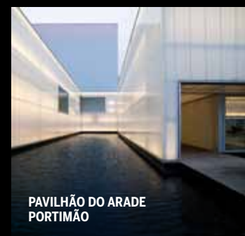
PAVILHÃO DO ARADE PORTIMÃO