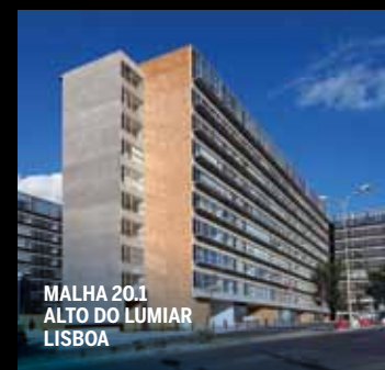
MALHA 201 ALTO DO LUMIAR LISBOA