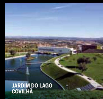
JARDIM DO LAGO COVILHA