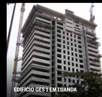
EDIFÍCIO GES 1 EM LUANDA