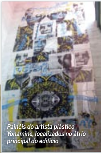
Painéis do artista plástico Yonamine, localizados no átrio principal do edifício