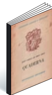
Quaderna de João Cabral Melo Neto

Há quem diga que é uma poesia difícil. Penso que, paradoxalmente, isso se deve à sua clareza.