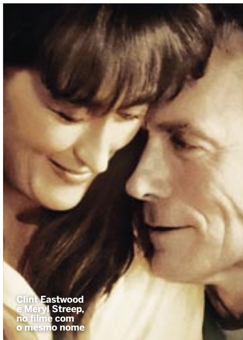
Clint Eastwood e Meryl Streep, no filme com o mesmo nome

Um clássico da literatura que vendeu, em todo o mundo, o equivalente a um livro por cada português.