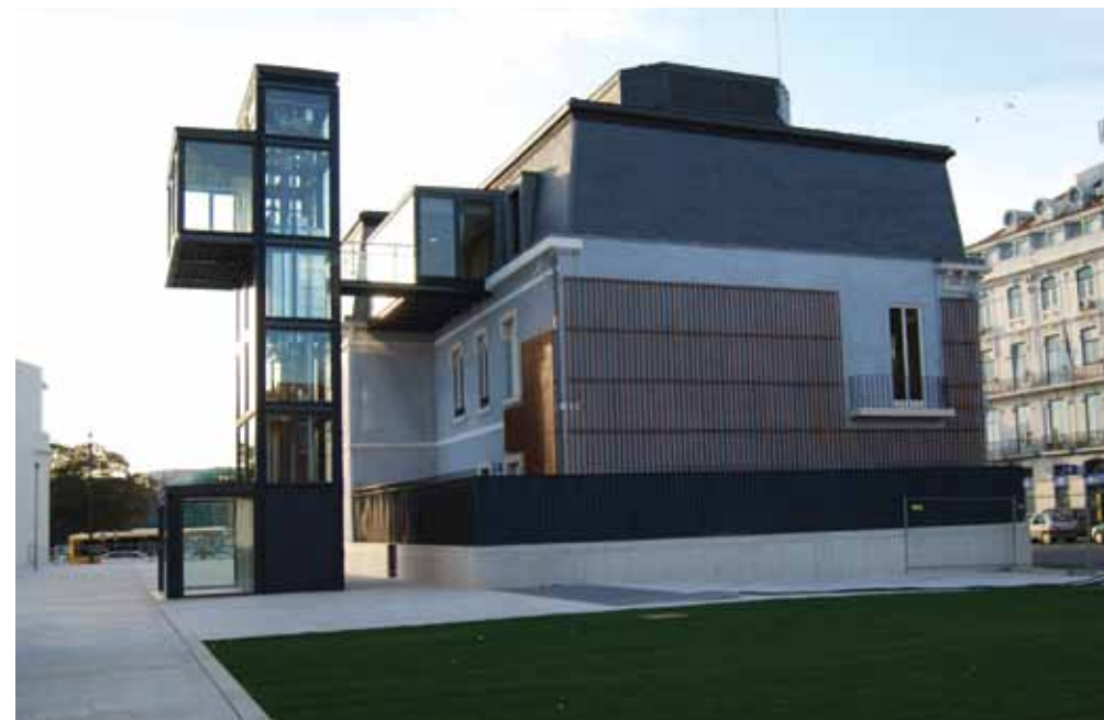
Palacete do Relógio, Cais do Sodré