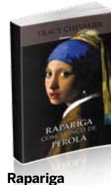
Rapariga com brinco de pérola

Uma obra muito bem escrita onde é quase possível sentir o cheiro do óleo e das tintas.