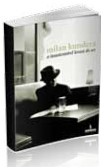
A Insustentável Leveza do Ser

Esta ambiguidade, que está na essência do nosso ser, dará o mote ao desenrolar da estória. Definirá Tomas, apaixonado e totalmente dedicado a Tereza, disposto a mudar de país por ela, mas incapaz de abandonar as amantes, entre elas Sabina, uma pintora atormentada pela convencionalidade (o kitsch), leve, sem pátria nem instinto de fidelidade, o oposto de Tereza. É da tensão esmagadora que se abate sobre estas vidas e as suas relações que se faz este romance imperdível, contrastando a leveza insustentável da vida humana quando projectada no drama esmagador de uma nação ocupada pelo regime soviético.