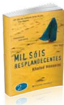
Mil Sóis Resplandecentes Khaled Hosseini Editorial Presença, 2007

T endo como palco o instável Afeganistão dos últimos 30 anos, é apresentada uma história plena de sensibilidade que, parecendo tão real, quase nos transporta para o cenário imaginado por Khalid Hosseini. O autor, que já antes tinha escrito “O Menino de Cabul”, um romance de enorme sucesso adaptado ao cinema, apresenta-nos aqui casos de desafio à vida humana, provações que somos levados a ultrapassar só porque vivemos num cenário de guerra, ainda por cima num país onde as mulheres são sujeitas a todo o tipo de privações e maus tratos. É um livro emocionante, que trata deste tipo de assuntos como nenhum outro, e que consegue de forma brilhante descrever-nos sentimentos, contados por cada uma das personagens na primeira pessoa. A certa altura, com tanta intensidade, chega a apetecer-nos entrar no livro para ajudá-las a enfrentar os seus dramas.