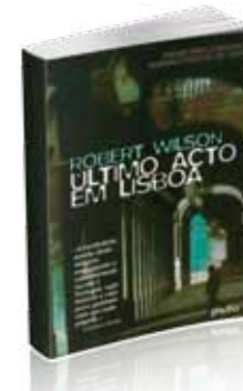
Último Acto em Lisboa Robert Wilson Gradiva, 1999

P ara quem gostar do estilo policial, encontra em Robert Wilson um verdadeiro especialista na arte de contar histórias. Este livro, um dos dez deste autor inglês (vive há anos em Portugal), desenvolve-se em dois cenários: a Alemanha da 2.ª Guerra Mundial, com um protagonista, Klaus Felsen, proprietário de uma fábrica em Berlim; e a Lisboa de final dos anos 90, com um crime sexual contra uma jovem adolescente, investigado por Zé Coelho, inspetor da PJ. As histórias são misturadas ao longo do livro, numa espécie de passado e presente, contados em simultâneo. Acabamos por perceber, depois de voltas e mais voltas, num enredo fenomenal, que os assuntos se cruzam. Mas não da forma mais óbvia, o que dá uma certa magia a um livro policial. Ainda por cima, como conhece bem a capital portuguesa, Wilson oferece-nos descrições quase perfeitas da vida em Portugal na viragem do século.