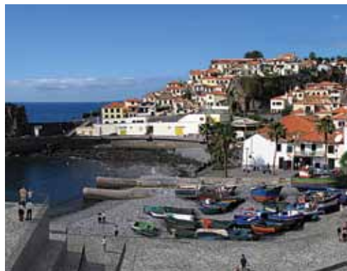
Reformulação da Baía de Câmara de Lobos

Pode ser mais entusiasmante fazer uma casa para um amigo na minha localidade do que fazer uma torre na 5ª avenida em Nova Iorque para utilizadores desconhecidos. Contudo, estou sempre a sair da região de diferentes for-