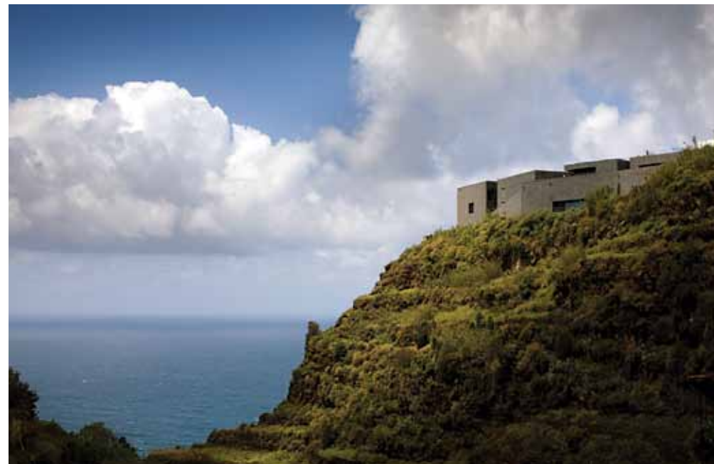
Centro de Artes da Calheta – Casa das Mudanças