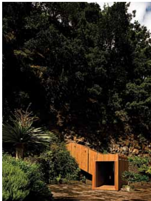
Grutas de São Vicente

‘Pode ser mais entusiasmante fazer uma casa para um amigo na minha localidade do que fazer uma torre na 5ª avenida em Nova Iorque para utilizadores desconhecidos’