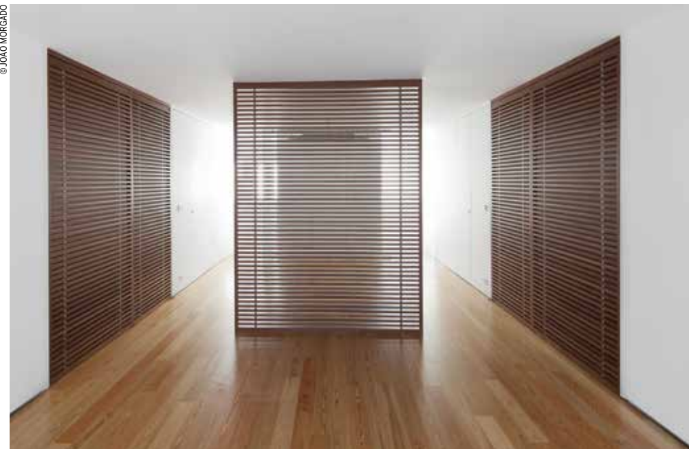
Lisbon Stone Block