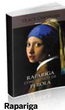
Rapariga com brinco de pérola

Uma obra muito bem escrita onde é quase possível sentir o cheiro do óleo e das tintas.