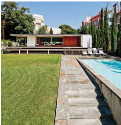
Casa Rua Saraiva de Carvalho

Para além da profissão de arquiteto, é Prof. na Universidade Lusíada, tem participado em várias conferências e seminários, e foi Prof. convidado na Universidade de Auburn, Alabama. Estas atividades paralelas são também uma vocação? Gosta de ensinar? Gosto. Gosto porque acho que um arquiteto que só se dedica à arquitetura, e que só faça arquitetura, dificilmente será um arquiteto completo. Aprende-se muito com as coisas que estão à nossa volta. Eu aprendo muito com o cinema, com a pintura, com a fotografia, com a