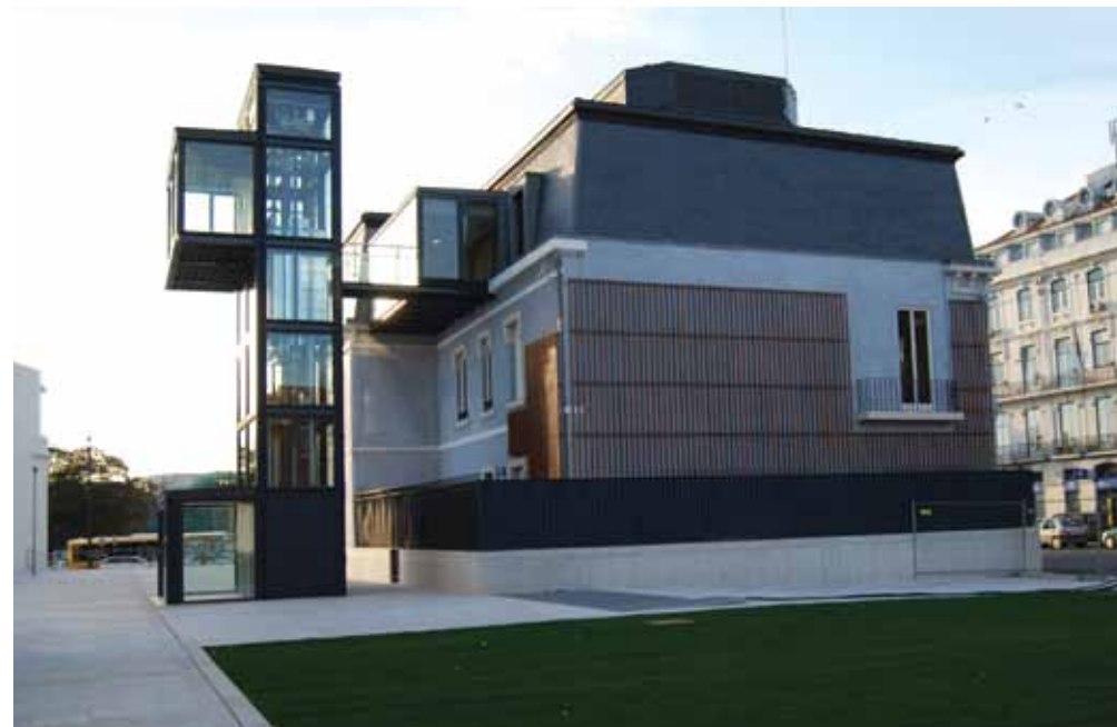
Palacete do Relógio, Cais do Sodré