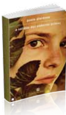
A solidão dos números primos

Este é um romance que não deixa ninguém indiferente.